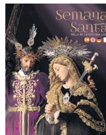
FOLLETO PROMOCIONAL. DA

Este año se ha renovado el diseño haciéndolo más atractivo. El folleto incluye las principales procesiones y cultos religiosos que se celebran en el municipio desde el pasado